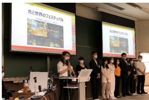
昨年の役員向けプレゼンテーションのようす

このたび、今年の産学連携の成果発表の場として、 4月から開始したプログラムの内容や、今年のイベントテーマを始め、12月に実施するイベントの全体概要を学生から APU 関係者、OHM 役員に向けて9月27日（水）にプレゼンテーションします。 また、別府温泉 杉乃井ホテルから販売する2日間の特別プランの発表も予定しています。本発表のようすを報道関係者さまに公開しますので、是非ご取材賜りますようお願い申し上げます。